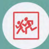
Опознавательные знаки «Перевозка детей»