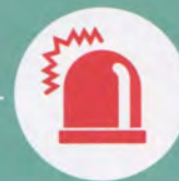
Маячок желтого цвета