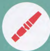
Штатные ремни безопасности