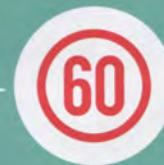
Опознавательный знак «Ограничение скорости»