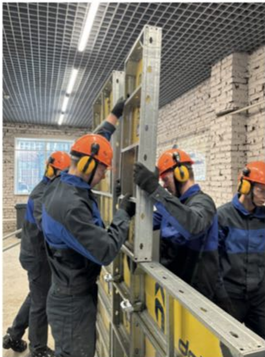
■ Практические задания студенты выполняют с помощью современного оборудования, которым оснащены мастерские техникума в рамках национального проекта «Образование»